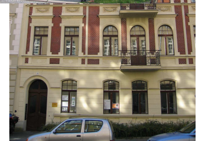
Gemeindezentrum in der Carl-von-Ossietzky-Straße 31